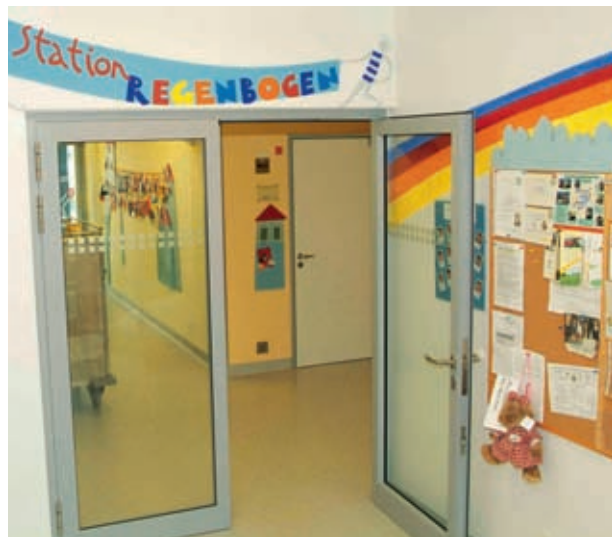
Eingang von Station Regenbogen