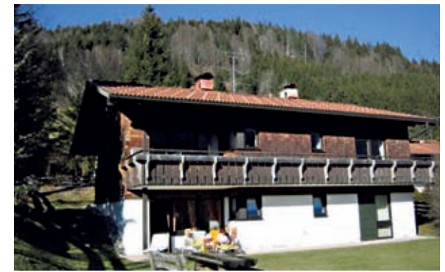
Ferienwohnung im Allgäu