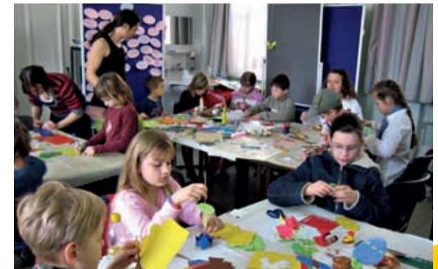
Basteln beim Frühlingsfest