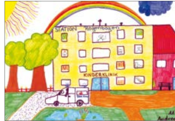
Druck: SGS-Staudenraus und Hart Druck; Gestaltung: Weigang PRO